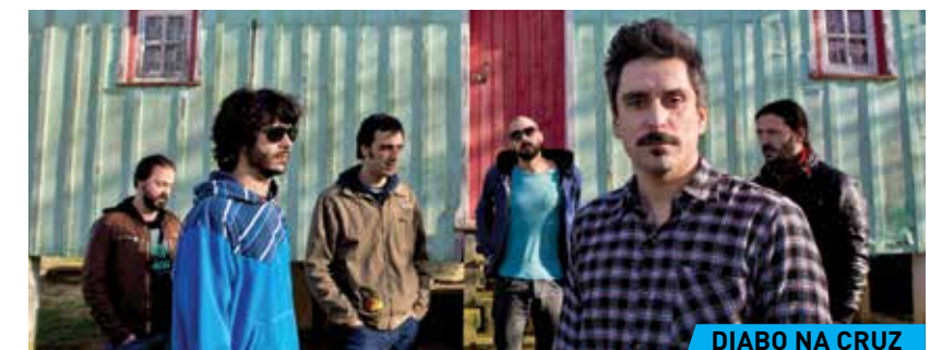
DIABO NA CRUZ